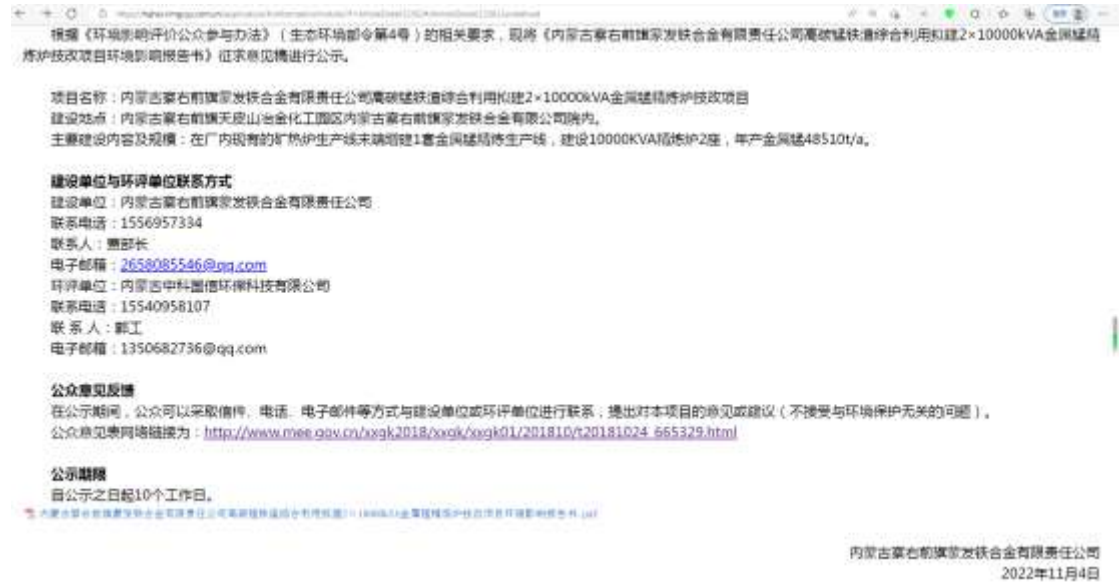
图 3-1 征求意见稿网络公示