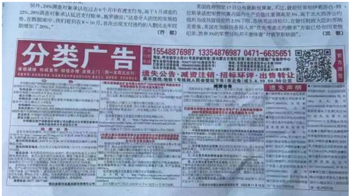
图 3-3 征求意见稿第二次报纸公示