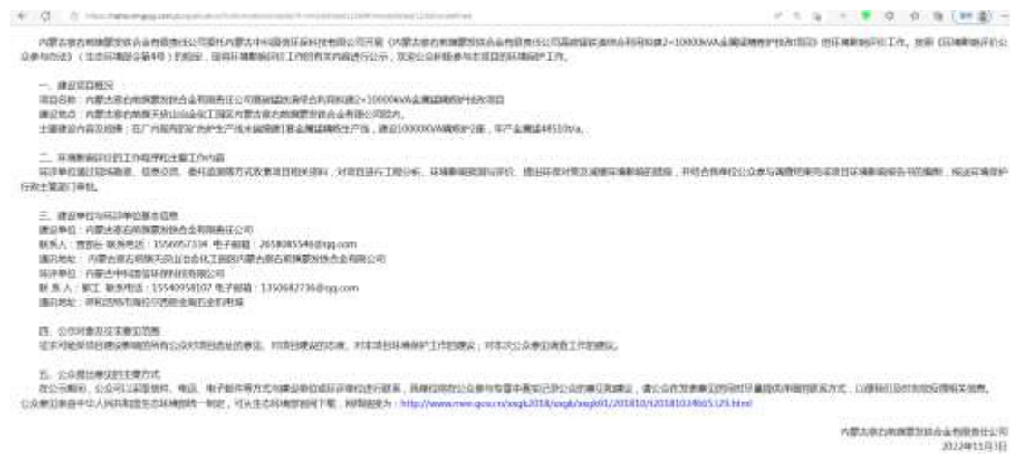
图 2-1 首次环境影响评价信息公示照片