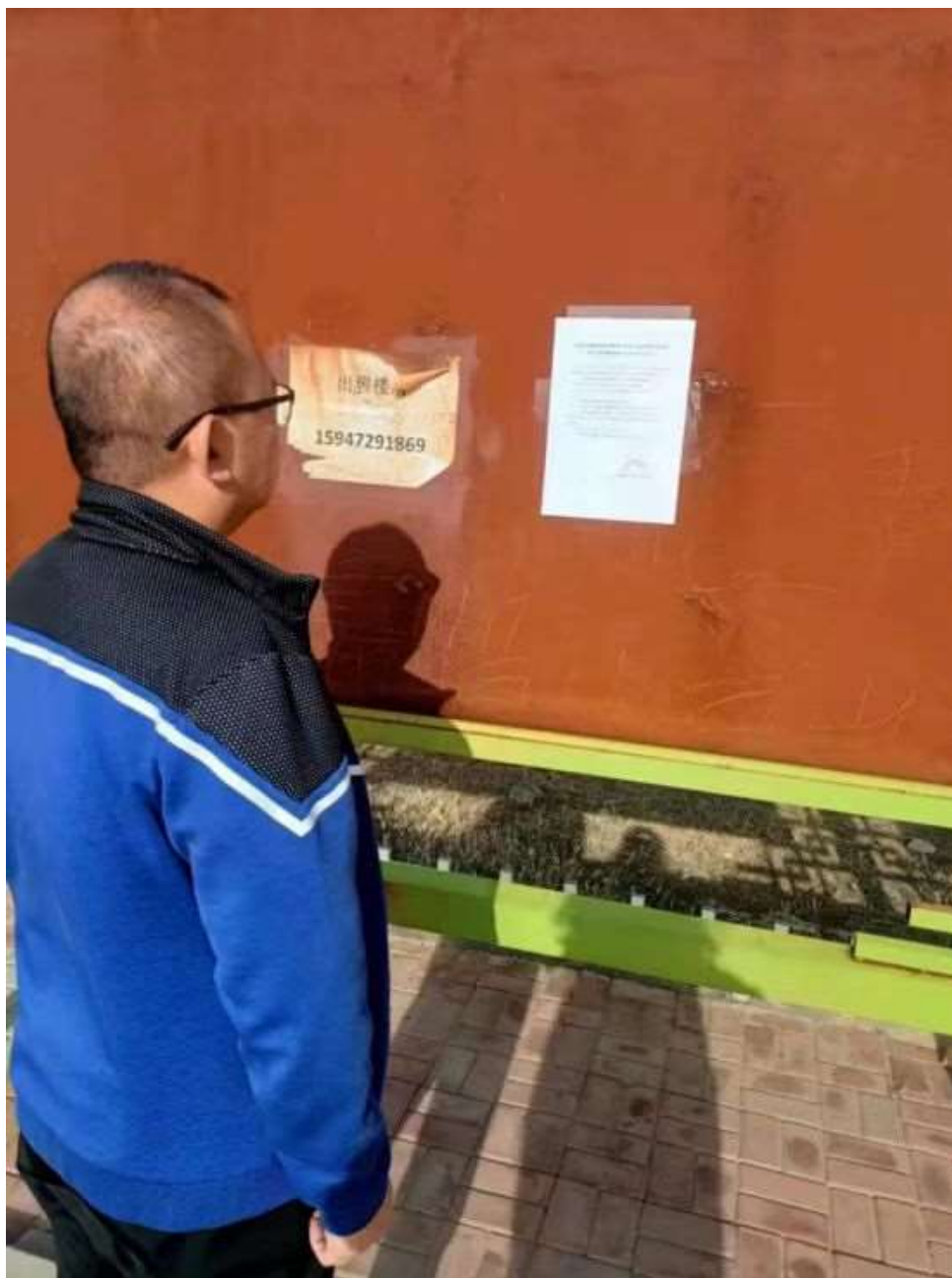
图 3-4 现场公示照片

建设单位于 2022 年 11 月 4 日起在项目所在地村镇及嘎查公示栏以张贴公告的形式对本项目的征求意见稿进行了为期 10 工作日的公示。同时本项目在考虑当地群众的公示信息的可获得性，实行当地走访调查，获取了当地群众的宝贵意见，现场公示照片见图 3-4。